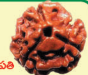
త్రిముఖీ రుద్రాక్షకు కుజుడు అధిపతి

మాడు ముఖముల గల ఈ రుద్రాక్ష కాలాగ్ని రుద్ర స్వరూపం. సూర్య, చంద్ర, అగ్ని అను త్రినేత్రములు గల రుద్రుడే కాలాగ్ని రుద్రుడు. ఈ రుద్రాక్షకు అధిపతి కుజుడు. సకల చరాచర జగత్తుకు మూలాధారమైన పరమాత్మ అయిన పరమేశ్వరుడు రుద్రస్వరూపం. ఈయన దక్షిణ అక్షాంతు సూర్య నేత్రంగాను స్వయం ప్రకాశం గల విష్ణువుగాను తెలుపుతారు. వామ అక్షాంతు చంద్రనేత్రం గాను ఆధారిత ప్రకాశం గల బ్రహ్మ స్వరూపంగా చెప్తారు. భృకుటి మధ్య ఉన్న పాలనేత్రము ప్రచంద కాలాగ్ని స్వరూపం మహేశ్వరుడుగాను చెప్తారు. ఇలా మాడు ముఖములు గల ఈ రుద్రాక్ష బహుశక్తివంతమైనది.