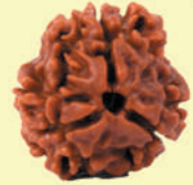
ఈ రుద్రాక్ష చంద్రభగవానుడు అధిపతి

“ద్వి వక్త్రంతు మునిశ్రేష్ఠం చార్ధ నారీశ్వరాత్మకమ్ ధారణా దద్ధ నారీశం ప్రియతే తస్య నిత్యశః”