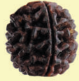
ఏకముఖీ రుద్రాక్షకు రవి అధిపతి

ఈ రుద్రాక్ష సాక్షాత్తు పరమేశ్వర స్వరూపంకు ప్రతీక ఈ రుద్రాక్ష యొక్క మహాత్మ్య ఈశ్వరుడు షణ్ముఖీనితో “త్రణ షణ్ముఖతత్వేన వక్త్రే వక్త్రే ధా ఫలమ్ ఏకవక్త్రః శివః సాక్షాత్ బ్రహ్మ హత్యం వ్యపాపాతి”